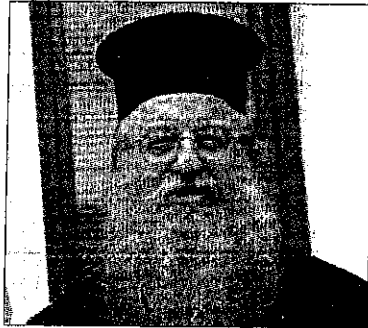
Ο Μητροπολίτης Θεσσαλονίκης, Άνθιμος.